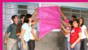
Descerramento de Placa