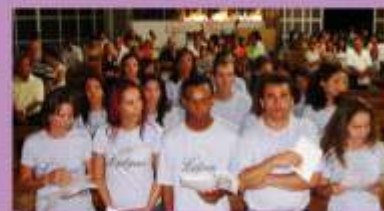
Missa em Ação de Graças