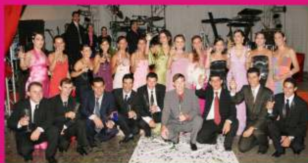
Baile de Formatura