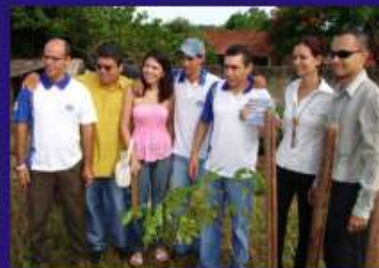
Plantio de árvore