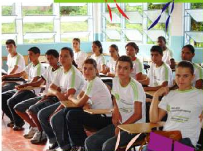
Projeto Cooperativando - Aula Inaugural