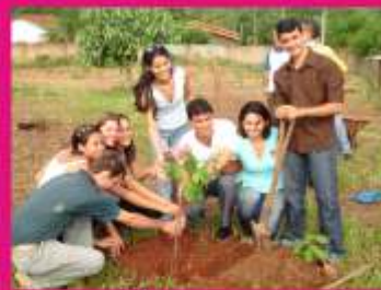
Plantio de Árvore