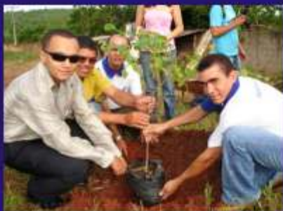
Plantio de árvore