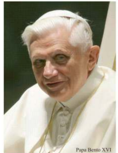
Papa Bento XVI