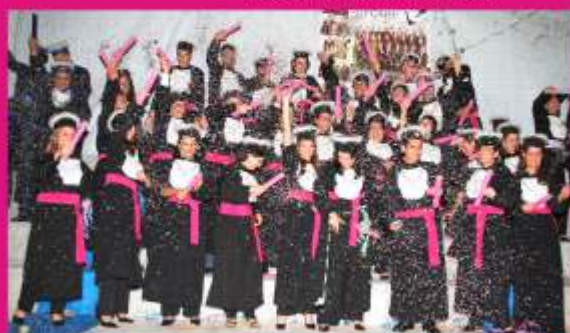
Colação de Grau