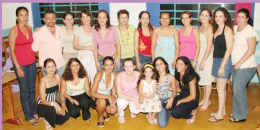
Aula da Saudade