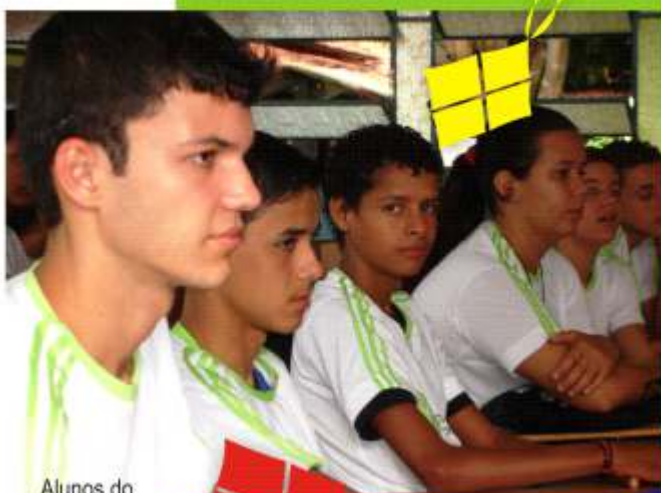
Alunos do Projeto Cooperativando