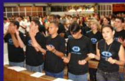
Missa em Ação de Graças