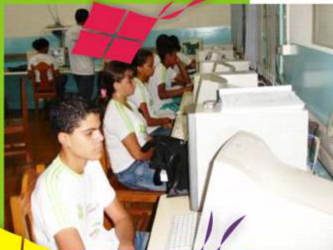
Aula de Inclusão Digital do Projeto Cooperativando

Para este ano de 2007 serão organizadas 4 edições do Projeto Cooperativando, duas no primeiro semestre e duas no segundo, com estimativa de levar atendimento a 120 adolescentes e jovens, o que somente será possível pela parceria empreendida entre a FCARP – Faculdade Católica Rainha da Paz e SICREDI de Araputanga que, além de demonstrar sua responsabilidade para com a sociedade, apóia incondicionalmente a formação humana como principal alicerce na construção de uma sociedade mais justa e solidária.