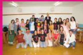
Aula da Saudade