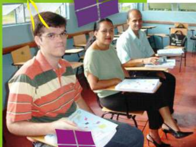
Professores do Projeto Cooperativando