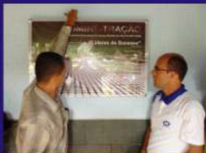
Descerramento de Placa