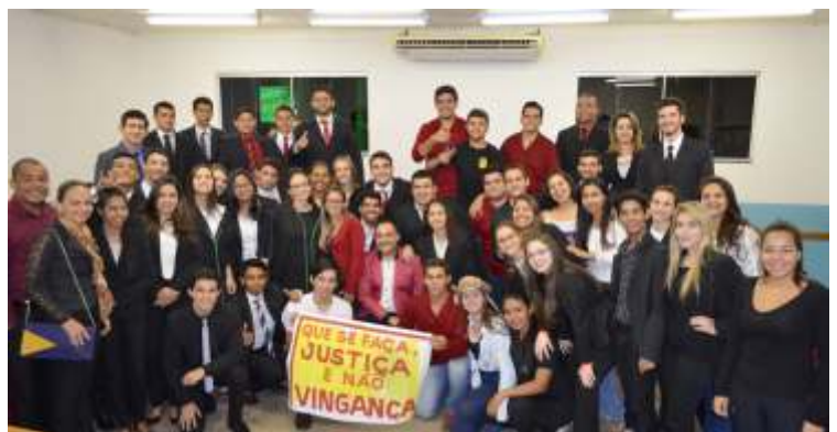
JÚRI SIMULADO: O CASO DOS EXPLORADORES DE CAVERNA