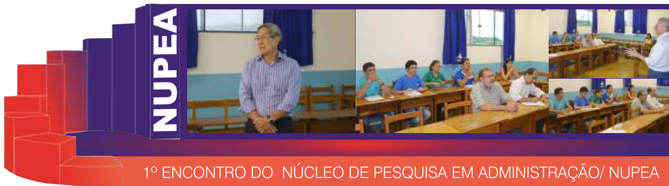
1º ENCONTRO DO NÚCLEO DE PESQUISA EM ADMINISTRAÇÃO/ NUPEA