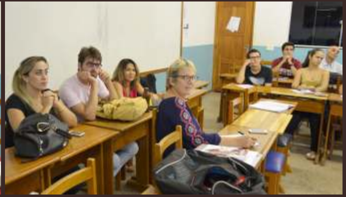
Conferência: A mulher e o Direito na atualidade – Parceria: 7ª Subseção da OAB/MT