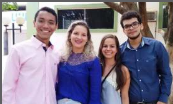
Participação dos alunos do curso de Direito/FCARP na IV Semana de Democracia e Direitos Humanos e IV Mostra de Cultura e Arte das Gentes do Pantanal, promovido pela UNEMAT.

O seu Núcleo de Monografias Jurídicas é referência e destaque em todas as visitas do Ministério da Educação (MEC) pelo fato de que nele se desenvolvem trabalhos de conclusão de curso relacionados aos problemas da região, trazendo soluções fundamentadas teórica, filosófica, social e culturalmente – a esse regionalismo o curso é destaque inclusive com publicações junto à Universidade Federal de Mato Grosso e ao CONPEDI, principal Congresso Jurídico de âmbito nacional.